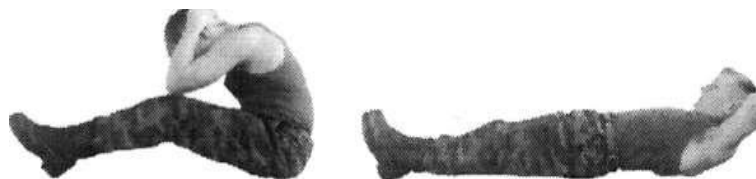
Рис. 2 Наклоны туловища вперед

Разрешается незначительное сгибание ног.